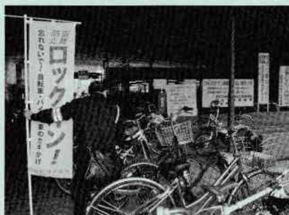
駐輪場での防犯点検～鍵は掛かっているかな