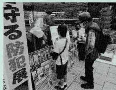
くらしを守る防犯展の開催