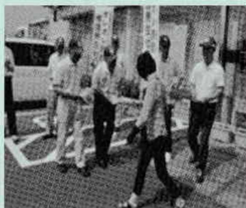
特殊詐欺被害防止の広報