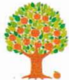
Jam Jam の木