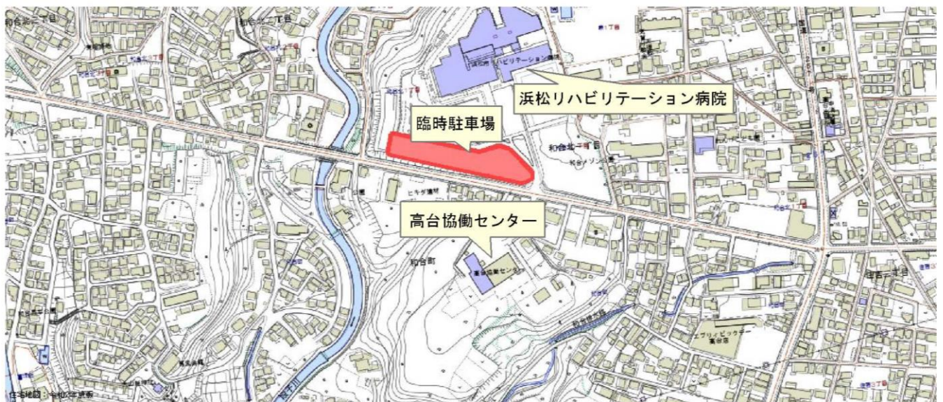
臨時駐車場のご案内・浜松市リハビリテーション病院