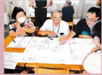
ひなんじょたいけんでのグループワーク

静岡県支部では、地域の防災力向上を支援するため、防災や減災に関する知識や技術を学べる「赤十字防災セミナー」を自治会等を中心に県内各地で開催します。