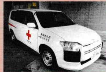
災害救護用自動車

また、市町への支援として発災時に避難所の状況確認やニーズを調整する職員派遣のための災害救護用自動車や、被災者へ迅速に救援物資をお届けするための救護用倉庫を更新します。