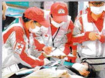
仮想傷病者の状態を確認する救護班