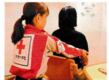
リラクゼーションを行うこころのケア要員

被災された方や被災者支援を行う行政職員など、心理的な支援を必要としている方々の悩みや不安に思っていることを傾聴するほか、ハンドケアなどの身体的リラクゼーションを行いました。